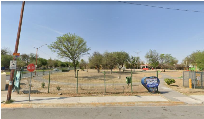
Parque para mascotas. Privadas de Anáhuac