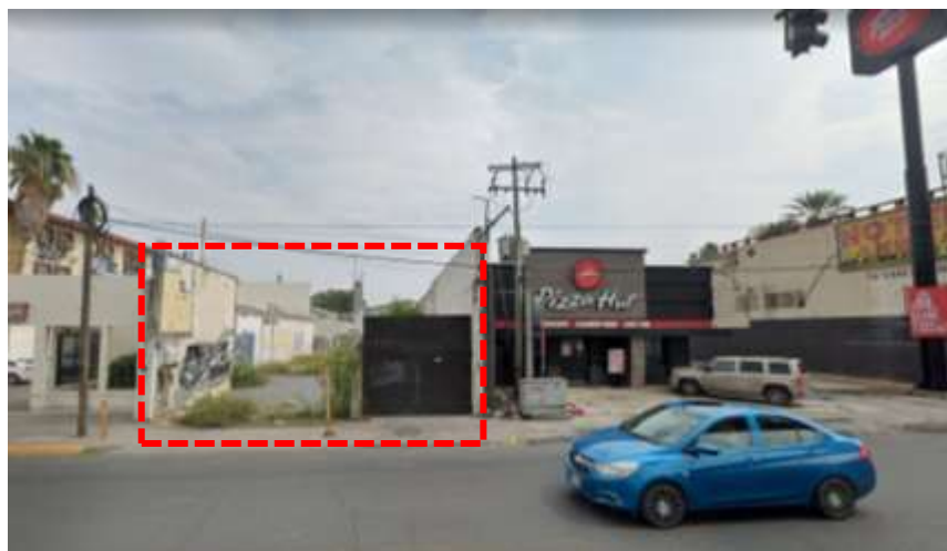
Fotografía Ave Universidad No. 322

https://www.google.com/maps/place/Avenida+Universidad+322,+Chapultepec,+66450+San+Nicol%C3%A1s+de+los+Garza,+N.L./@25.7417931,-100.3020835,260m/data=!3m2!1e3!4b1!4m13!1m7!3m6!1s0x8662945700c71be9:0x6ec42f45a1ea4d00!2sAvenida+Universidad,+An%C3%A1huac,+San+Nicol%C3%A1s+de+los+Garza,+N.L.!3b1!8m2!3d25.7369106!4d-100.3037808!3m4!1s0x866294f44bd7cc03:0x9b57f6ac0d422e7b!8m2!3d25.7417919!4d-100.3015363