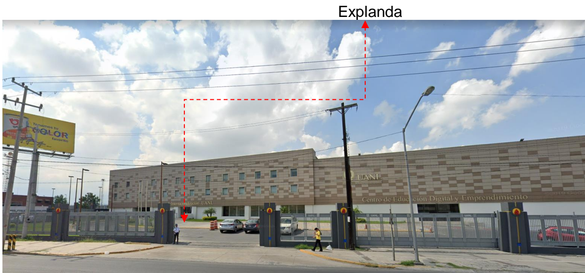
Fotografías exteriores de la explanada

https://www.google.com/maps/place/Centro+De+Internacionalizaci%C3%B3n+UANL/@25.7248893,-100.316242,313m/data=!3m1!1e3!4m5!3m4!1s0x8662944da1f1c7a5:0xcda9dccbefdb1cb8!8m2!3d25.7247208!4d-100.3178063